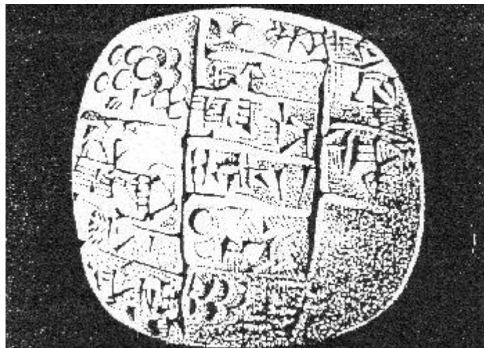
Tauleta del III mil·leni a. C. d'una població de Síria.