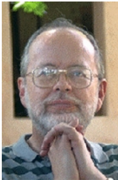
Lluís Maria Xirinacs (1932-2007).